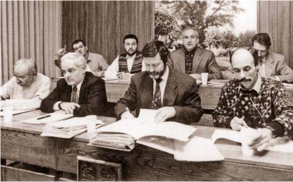
Sui banchi del Municipio durante una seduta del Consiglio Comunale.