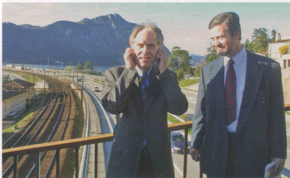
Con Moritz Leuenberger quando era sindaco di Bissone.