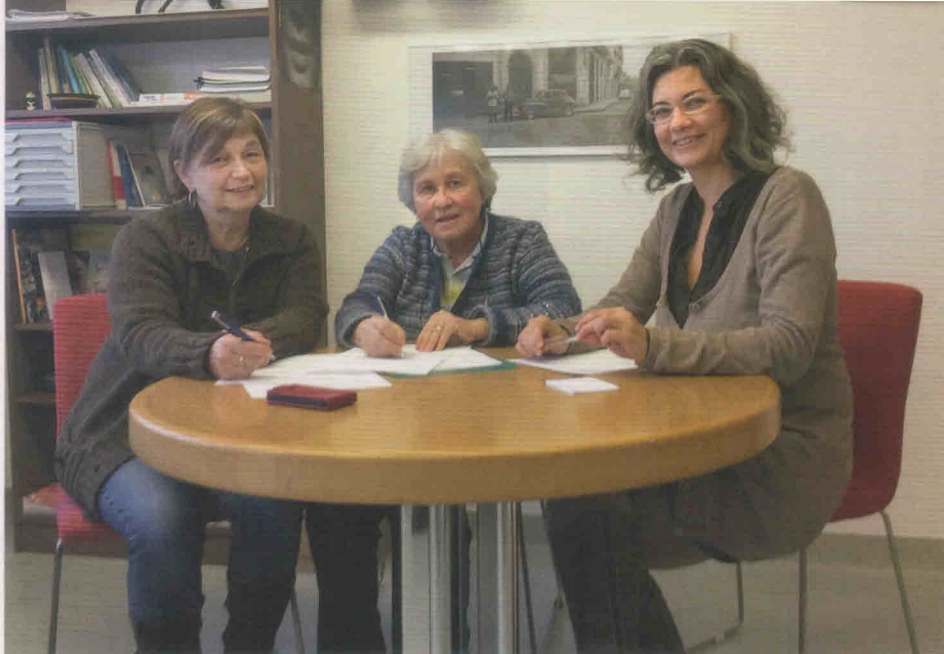
Il team del segretariato.

lo di presentare un'immagine più giovanile dell'Atidu. Ed è quindi per questo motivo che abbiamo creato due nuovi gruppi di incontro. Uno per i genitori, gestito da una mamma è da un'audiopedagoga (entrambe membri di comitato), con lo scopo di far incontrare le famiglie con figli deboli di udito e scambiarsi così esperienze reciproche. L'altro gruppo rivolto ai giovani è gestito da una dottoranda presso l'Accademia di architettura di Mendrisio (anch'essa membro di comitato), che si prefigge l'obiettivo di far incontrare fra loro giovani deboli di udito per condividere assieme il loro vissuto.